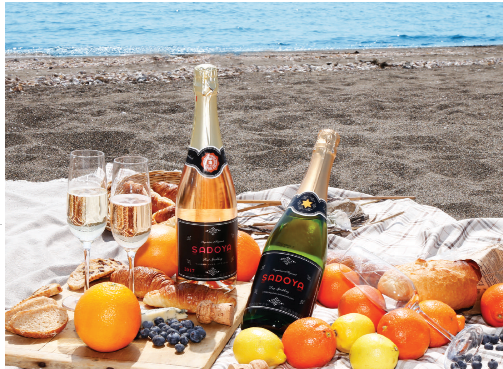
※写真の商品は以前のヴァンテージです。